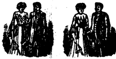
Înainte de întrebuintare.