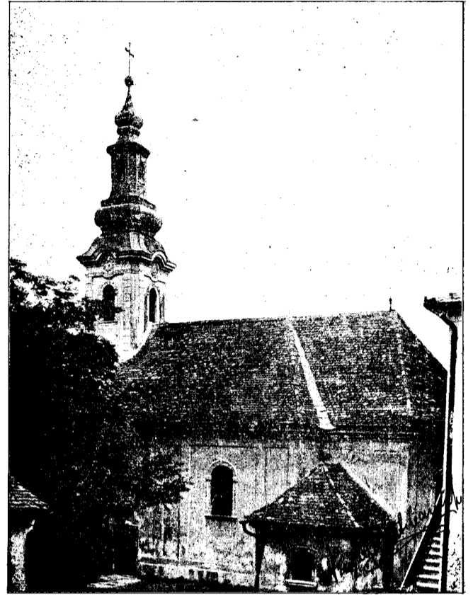
Biserica lui Bob în Cluj.

1. Titlul I. al Decretelor este închinat întreg comemorării sărbătorești a evenimentului aceluia mare, întâmplat înainte cu două sute de ani, când părinții noștri la 5 Septembrie 1700 au încheiat sfânta Unire religioasă cu Biserica Apostolică a Romei celei vechi. Juvenitu-s'a și sfânt și evlavios a fost gândul Părinților Sinodali, ca inaugurarea lucrărilor Sinodale s'o înceapă cu sărbătorirea, pomenirea și eternizarea aceluia fericit eveniment, care a fost începutul unei Legi noave, a noului Testament pentru poporul românesc, deopotrivă în privință religioasă cât și culturală. Manifestul sfintei Uniri, pecetluit în Bălgradul Ardealului, pentru poporul românesc a fost Tablele Legii aduse de Moise poporului evreesc de pe muntele Sinai. Unirea bisericească încheiată cu mama Biserica romană marchează în istoria neamului nostru tocmai așa o graniță, ca și Crucea de pe Golgota. Unirea a fost în-