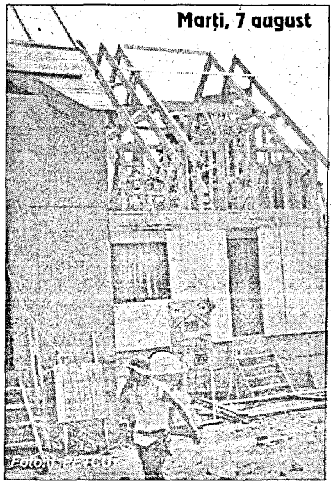
Marti, 7 august

Ministerul Turismului a solicitat conducerii SIF Transilvania, acționar majoritar de la Eforie SA, demiterea conducerii societății, pentru incapacitate managerială.