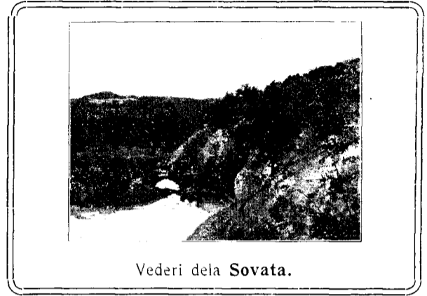
Vederi dela Sovata.

Eminescu, acel mare poet Eminescu, care s'a ridicat ca un luceafăr pe orizont, și a dispărut ca un meteor, lăsându-ne în uimitoare privire a înălțimilor la care a ridicat poezia la noi — acel Eminescu, pesimist, rece, aproape supraom, — care pe mulți i-a revoltat cu pesimismul omoritor și pe mulți i-a omorât cu farmecul cuceritor a noiei arte — acela nu era Eminescu cel adevărat, ci numai o viziune nocturnă, în focul bengal al geniului și straiul de purpură și aur al poeziei strălucitoare — în care fu prezentat el — prin oare cine. Adevăratul Eminescu acum ni-se înfătoșează,