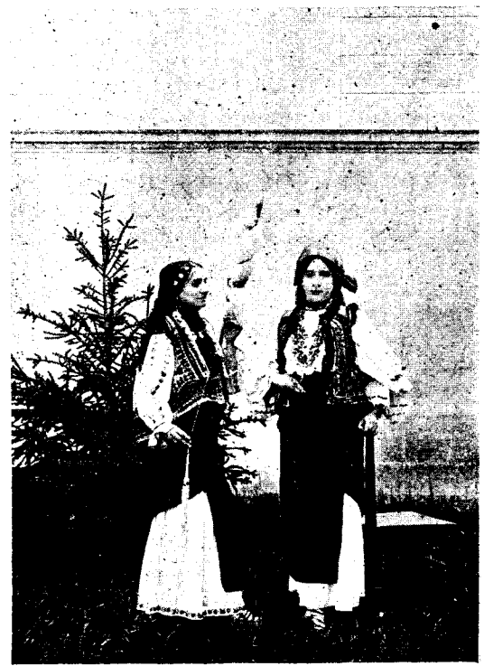
Port românesc din părțile Năsăudului.

religiunea . Viața intelectuală are doosebite direcțiuni și felurite formațiuni: uneori sufletul vrea să înțeleagă și atunci alcătuieste știința , uneori vrea să plămuiască și atunci crează arta , altădată sufletul se pune în raport cu nemărginitul cu viața vecinică, cu eternitatea și se orientează după ea: aceasta pornire adâncă, de o forță străveche, care mai târziu se desvoaltă în conștiință, ca simț și ca simțământ, este religiunea . Ea nu e o aparență goală pentru ochi, nu e o formalitate esternă, ci este ceva lăuntric și adânc. Nu există religiozitate fără simțire profundă. De aceea națiunile cu bun simț adânc sunt cele mai religioase.