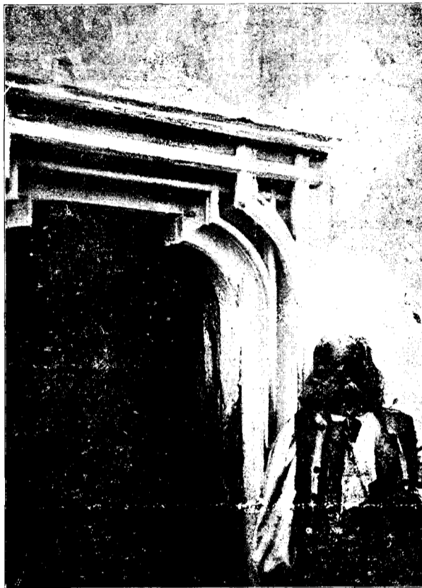
Ușa principală a bisericii istorice din Feleac.

Acolo jos, în împărăția sărăciei și a nemângăierii, unde durerea e prietină și nenorocul e frate de cruce cu neamul de oameni prăpădit de atâtea rele și ticăloșii, acolo, frați de-o vârstă, se deschide larg drumul înflorit al apostoliei și al muncii.