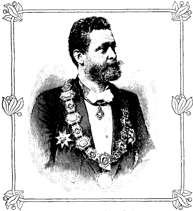
Primarul Vienei Dr. C. Lueger.

Ca foaie care este călezită de principiile creștinismului pozitiv, ne facem plăcerea a ne împodobi acest număr cu chipul aceluia bărbat, care în împărătescul oraș al Vienei a ridicat și a dus la isbândă steagul vieții creștinești, luptând împotriva acelor ovrei și argați ai lor, cari au inveninat cu rățecitele lor idei viața sufletească a popoarelor, ear cu apucăturile lor au exploatat și exploatează neamul creștinesc în tot chipul.