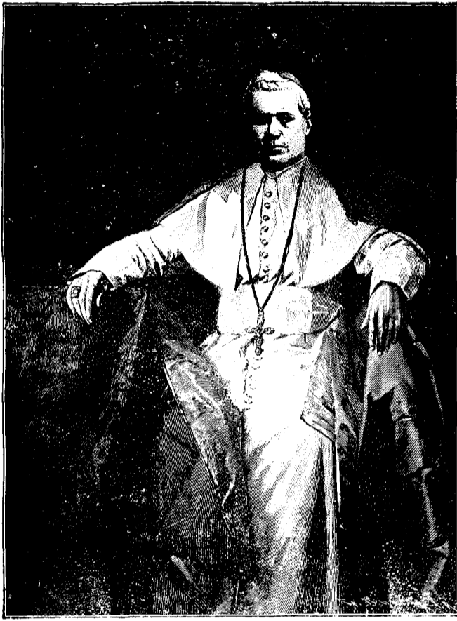
Patriarchul Romei, Papa Piu X.