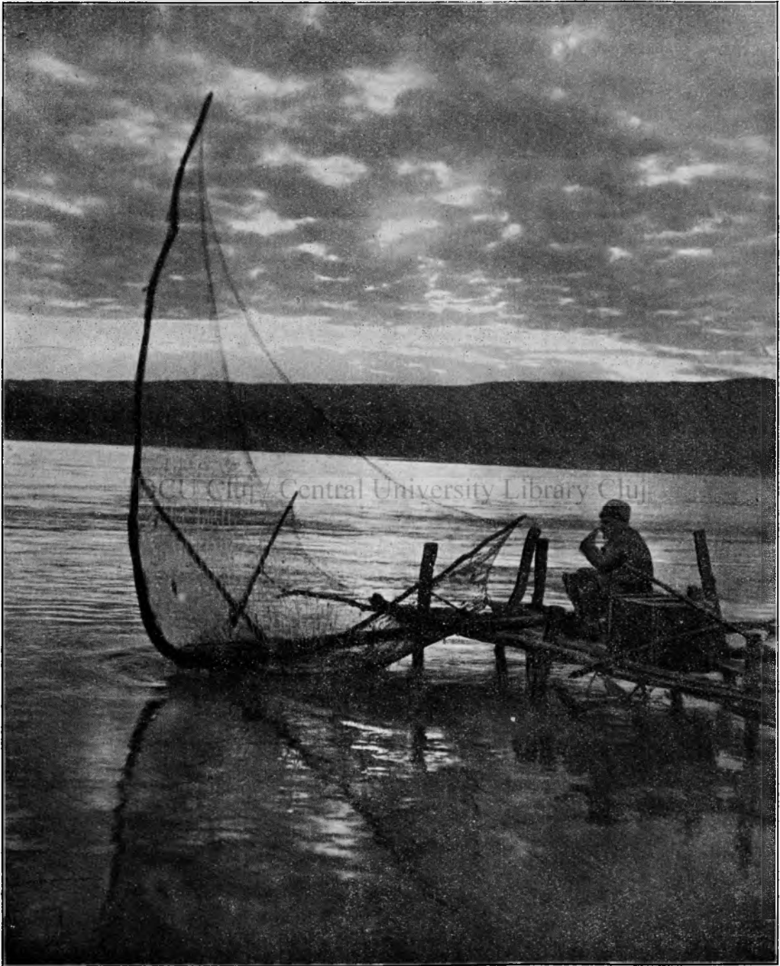
Pescar pe Dunăre