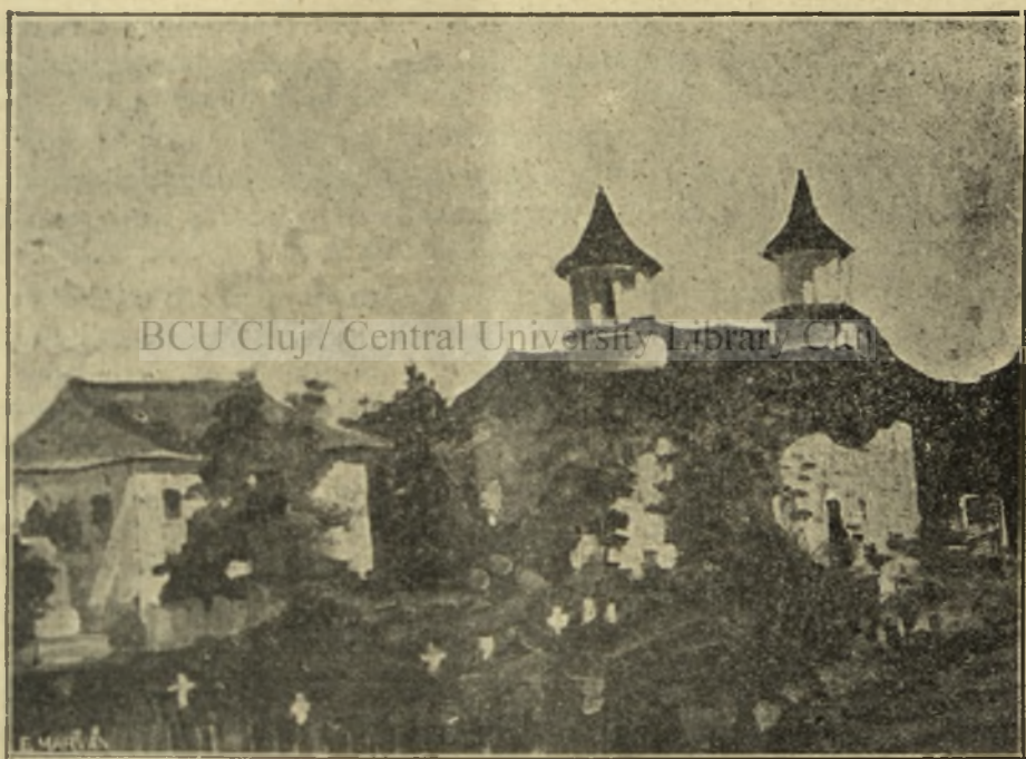
Biserica din Ocnița-Vâlcea „Dalina”