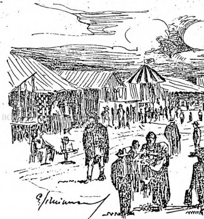
In bălel la Râureni „Dallna”