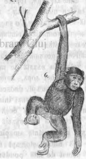
Fig. 1. Castor; fig. 2. Пасереа Репъзликанхлъ; fig. 3. Алъина; fig. 4. Пичьорхлъ de d'иньрхлъ алъ алъинеi; fig. 5. Къйхлъ веспелоръ; fig. 6. Маимъца Орангъ-Стангъ.

трх фачериле до vine че ле-а приимитъ. инцелече интпистареа стъпнхлхй стъ, врекьмъ шu минia са шu кастъ npin мингьере а-лъ индхлелека; ама даръ vedemъ къ, kindъ стъпнхлхл аъ лхатъ пълъ- риа шu бастонхлхл воиндъ а ешu ла плимьаре, кинеле indatъ vine а-лъ мингьиа, ка kindъ аръ voi а-лъ индхлелека стъ-лъ ia шu пе елъ ла плимъ- варе.—