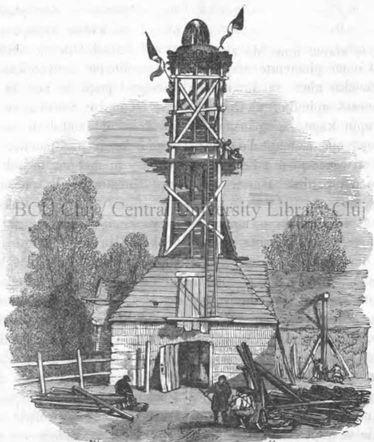
Пѣцѣлѣ Artesianѣ де Grenelle ла Парїсѣ.

tїндѣ сѣ рѣмїе в тѣр'їнсѣлѣ в старе де аѣрї, се їндесѣ фѣкїндѣ-се пїкѣтѣрї флїде каре кадѣ жосѣ в формѣ де плоае, саѣ кѣ пїкѣтѣрїле в тѣрѣдѣ не дрѣмѣ мї кадѣ жосѣ в формѣ де зѣпадѣ саѣ де гїндїнѣ; апой апеле де плоае, де зѣпадѣ мї де пѣатѣ се стїкорѣ в крѣпѣтѣрїле пѣмїнтѣлї маї кѣ seamѣ ѣнде пѣмїнтѣлѣ е нїсїнос, мѣрїндѣ тотѣ в жосѣ кѣтѣре сїнѣлѣ сѣлѣ пѣлѣ гѣсескѣ о стратѣ де пѣмїнтѣ галбенѣ, каре есте їмпермеабїлѣ пѣнѣтѣрѣ апѣ, де ачееа апеле нѣмаї потѣ