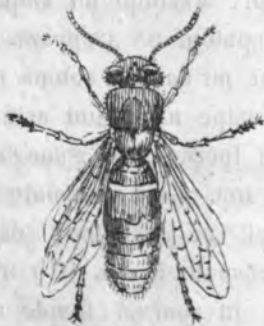
Vespa Crabro .

Kind însă rețina și perde antenele sale, saș kind i le-a țiat cine-va, atânci și a perdut domnia, kăci a perdut mizlokkă și prin kare a năst s' se ințeleagă kă noștră stă, kăci kă antenele ea împințe pe albinele lăkrătoare kă s' lăkreze; apoi dăne ce rețina și perde astopitate sa, konfesiunea cea mai mare domnește în stăpă. Dar și albinele vâzind a mîngăie pe rețina lor și a' arță s'șuzperea lor, o fak kă antenele; apoi și rețina ear kind e mlațimă de vr'o albină lăkrătoare, o mîngăie intr'un mod partikulară kă antenele ei. D. Latreille a probat prin esperimente, că țind antenele albinelor, ele nu mai sînt în stare a gâsi niș dărmă la stăpă și se părăcesc, prin șmare antenele le servescă kă un kondăktoră instinktivă.