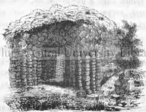
II. Каверна де çринă la Betrich-Baden.