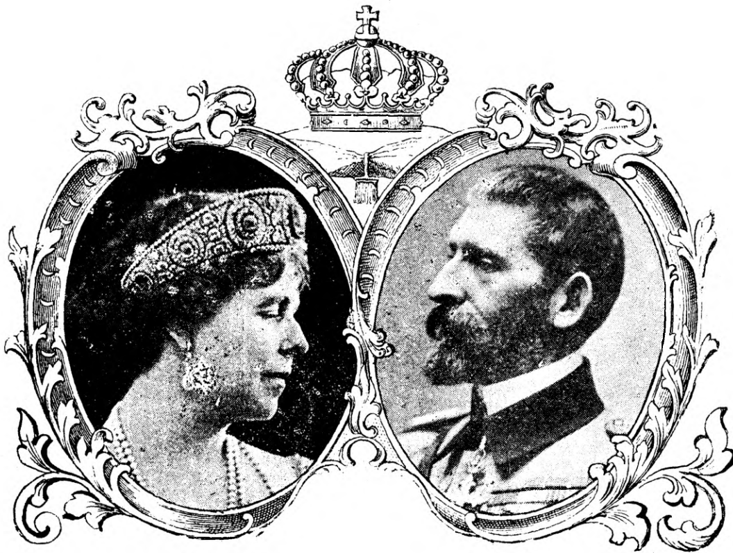
E. Marvan P.

Telul de purtare al acestora oscilează între înjurături și jurăminte sgomotoase pe numele și la adresa Ființei Preaînalte.