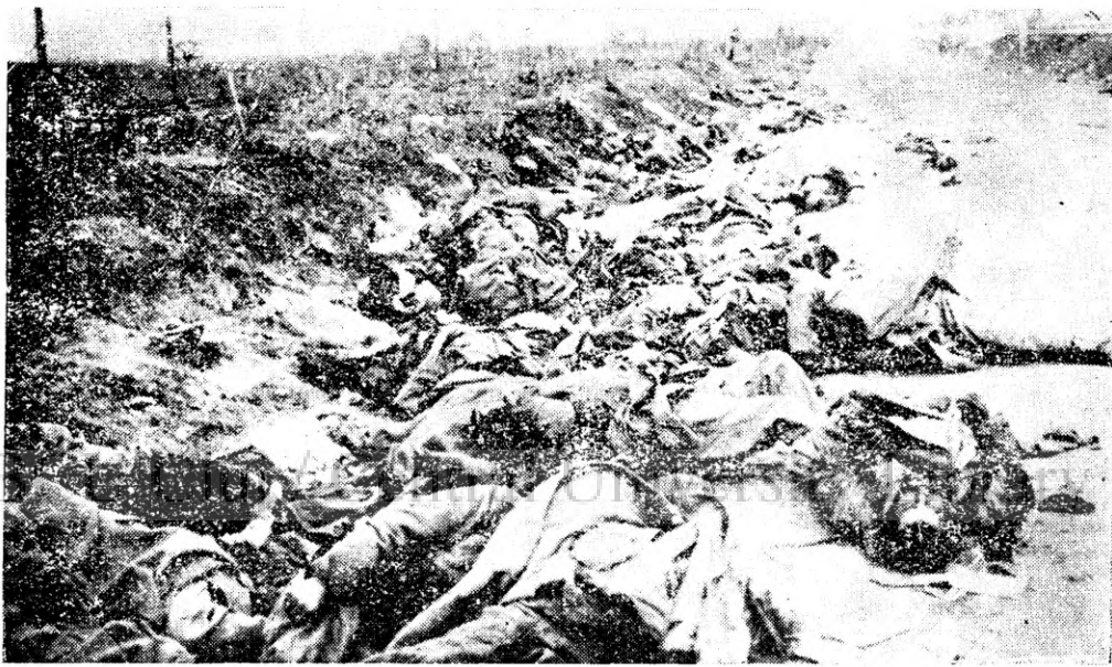
TRANȘEEA MORTII DELA BARTOLOMEU Fotografiată a doua zi după luptă

n'au încremenit pe Dealul Mateiașului cu ochii spre culmile de unde începea Ardealul; câți Dobrogeni n'au rămas pentru totdeauna în pământul presărat cu atâtea urme ale civilizației romane! Și, mai ales, cine i-a numărat vreodată, pe toți cei ce au scris paginile epopeei din Moldova!