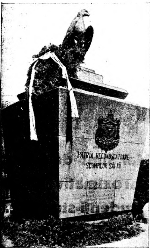
Monumentul eroilor dela Bartolomeu