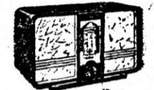
TIP 215 cu super mic cu glas puternic