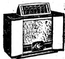
TIP 752 cu super excepțional

UN APARAT DE CALITATE DURABIL ESTE UN ADEVĂRAT PRIETENI