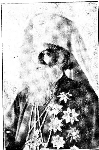
Patriarhul Miron Cristea

țiunilor anarhice sunt semnalele luminoase în besna care cuprinsese o parte a tineretului. Locul studențimii nu poate fi decât alături de Lege și Națiune.