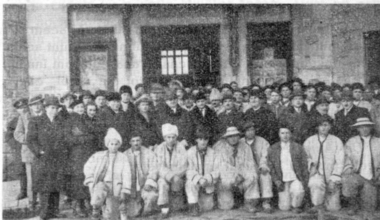
Participanții la Congresul școlii țărănești, Sighet.