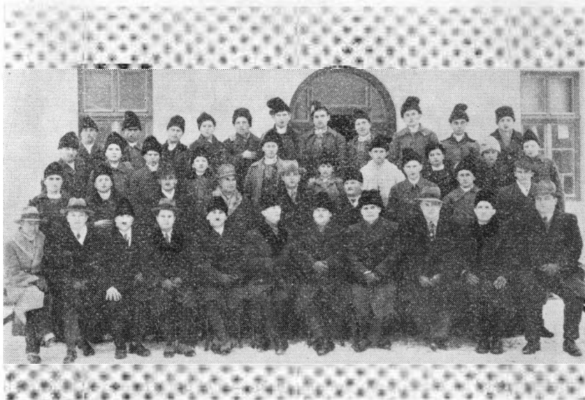
Școala țărănească din Bistrița.