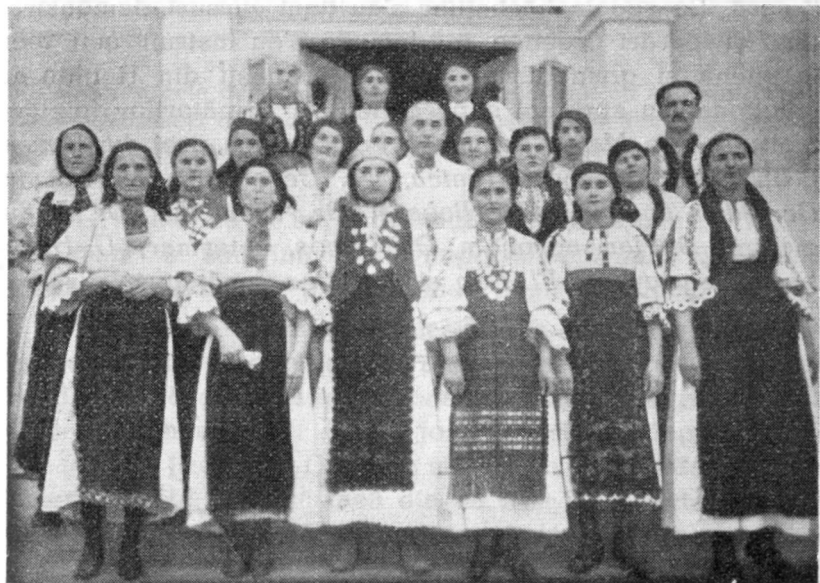
Elevele școlii țărănești din Reghin.