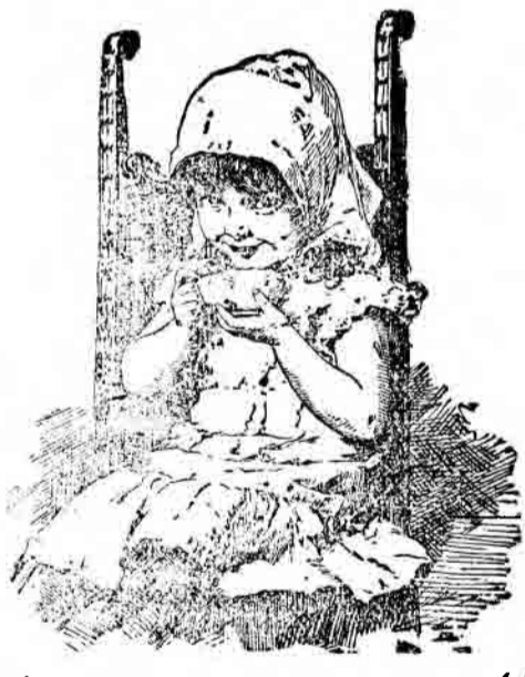
„Mă-mi place mai mult!“

Pachete fără numele Kathreiner nu sunt veritabile.