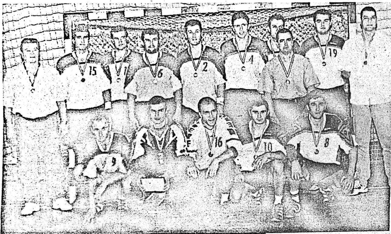
Pagină realizată de Nușa DEMIAN