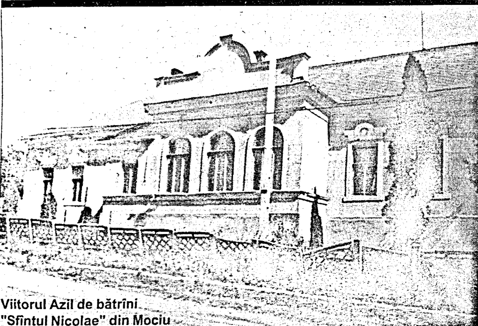
Viitorul Azil de bătrîni "Sfîntul Nicolae" din Mocuși