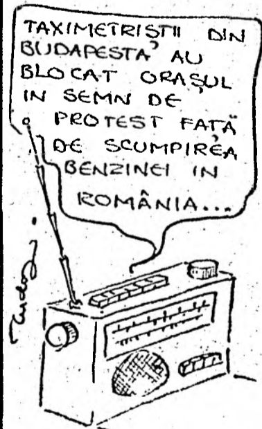
Desen de Taloș BALAS