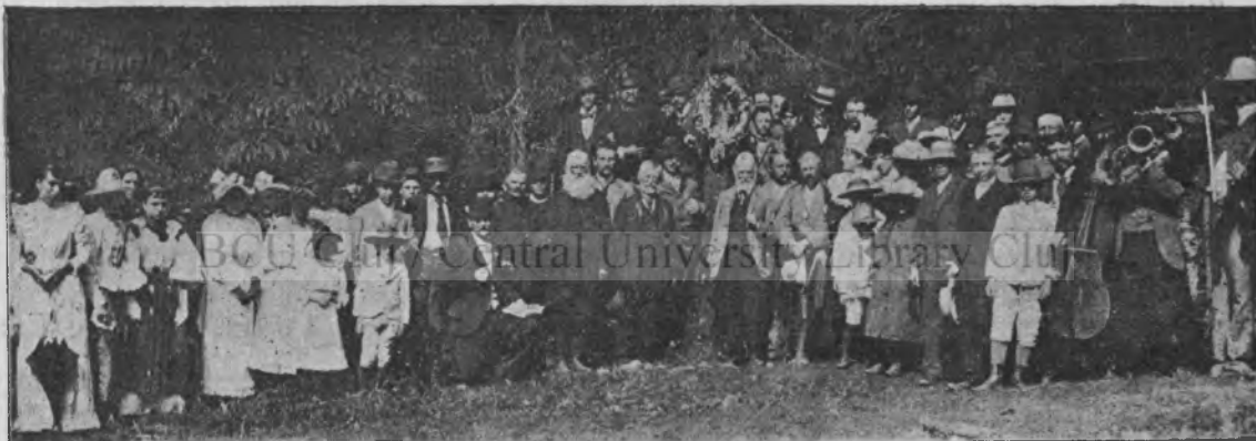
A Vasvári-kör I. évi közgyűlésének képe.