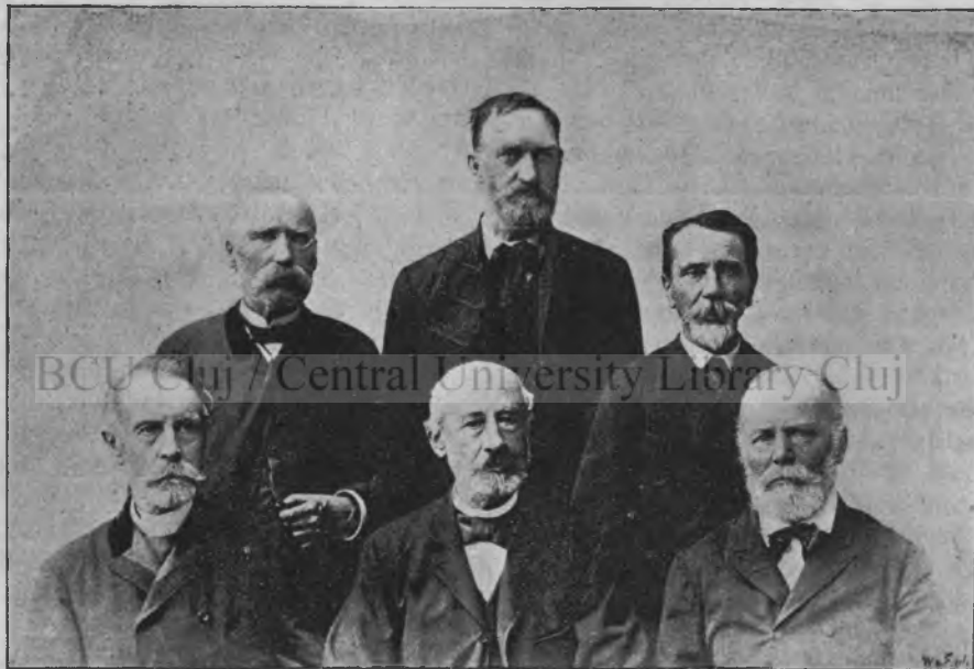
Csoport a budai honvédszobor leleplezésén résztvevőkből.

Virágokat szórtak, s kendőket lobogtattak elébök; a kiknek sikerült egy-egy nemzeti zászlót elrejtteni, azt most kitézték. Az egész várost valóságos örömláz lepte el. Minden úton iparkodtak elragadtatásukat kifejezni. A huszárok kezeit, térdeit csókolták, s akik nem értek hozzájuk, paripáikat csókolták. Egy máig is élő, kiváló úrnő lelkesedésében zsebkendőjét teletömve pénzzel oda nyújtotta az egyik huszárnak, ki a pénz markába szórva. visszaadta azzal a megjegyzéssel: ad nekünk a haza, a kendőt pedig zsebregyűrve, szól: ezt megtartom emlékül. (Ilyen önzetlen, ilyen büszke volt a honvéd.)