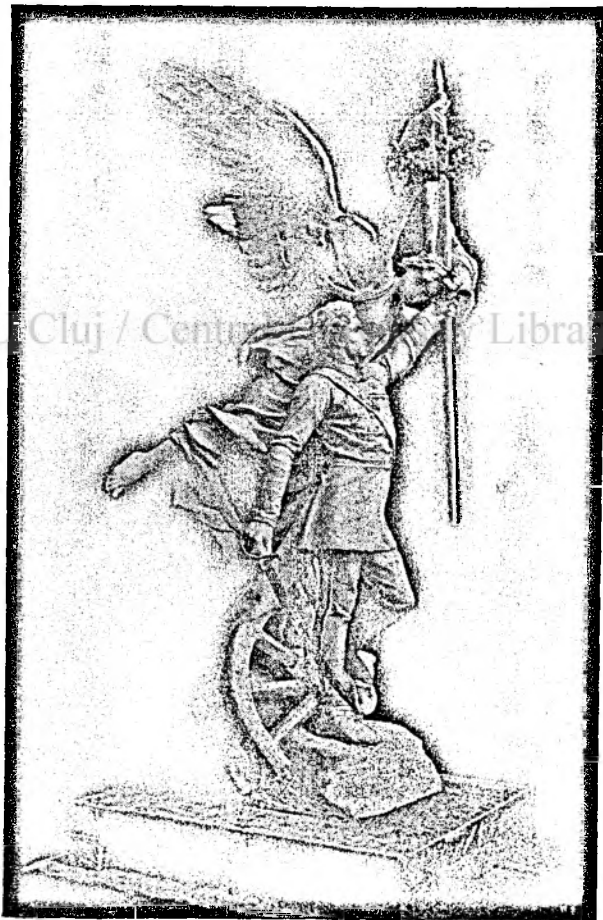
A budai honvéd-émlék.

„Csak 45 évi nyomorból követhetünk.“ (Esztergomi honvédek).