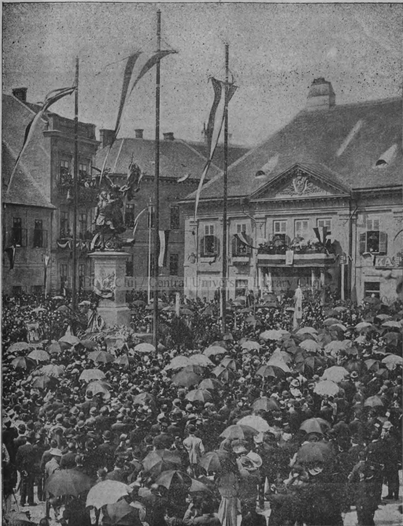
A budai honvéd-szobor leleplezése.