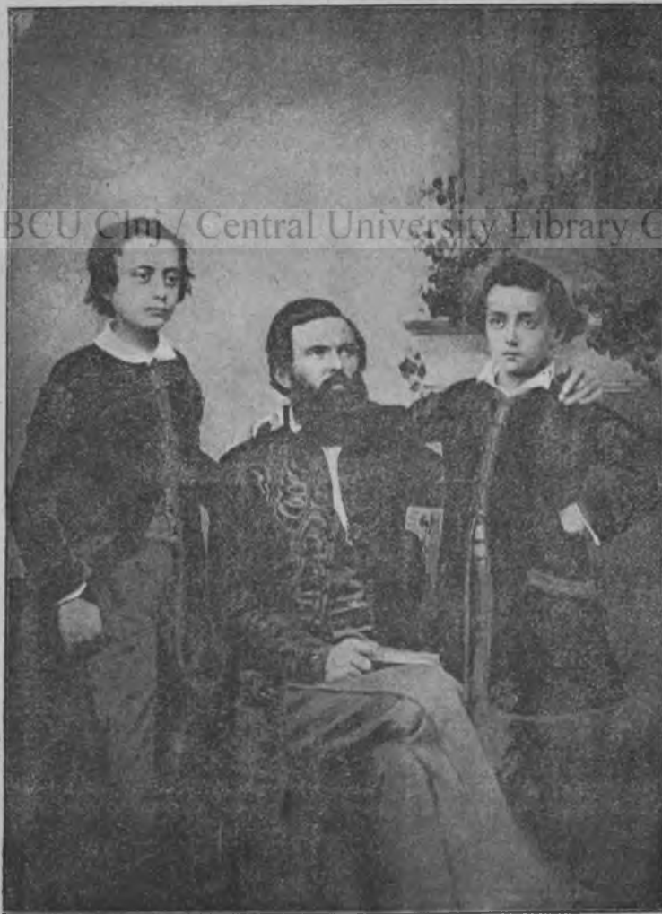
Kossuth Lajos fiai nevelőjük társaságában.

M e g j e l e n i k m i n d e n h ó 1-é n é s 15-é n.