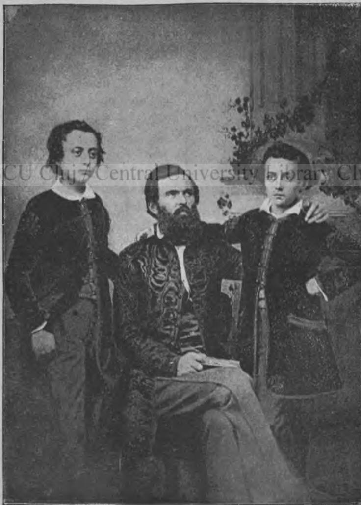
Kossuth Lajos fiai nevelőjük társaságában.

1848—49-es honvéd-százados s az orsz. honv. közp. választmány tagja.