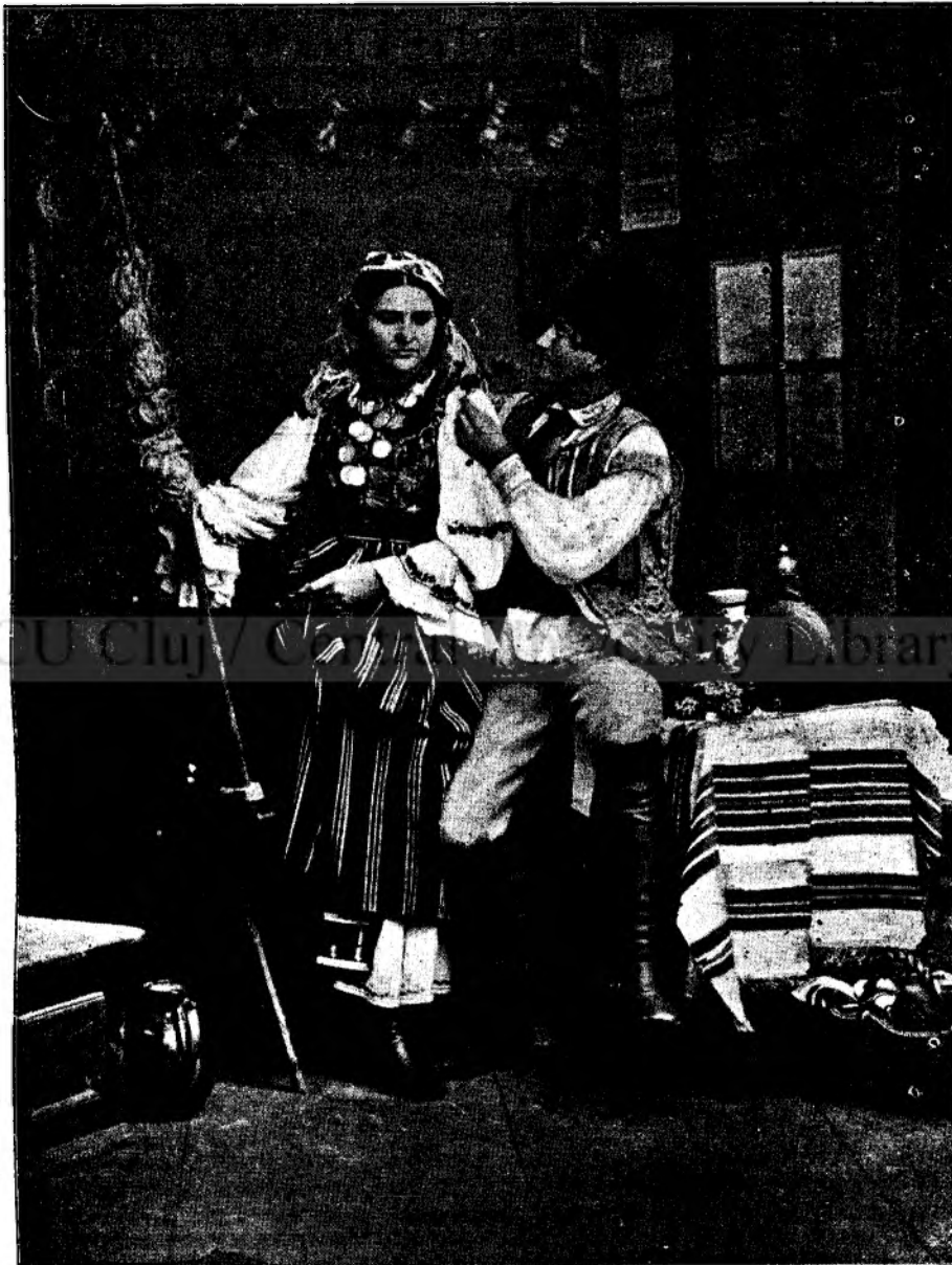
Port dela Bistrița.