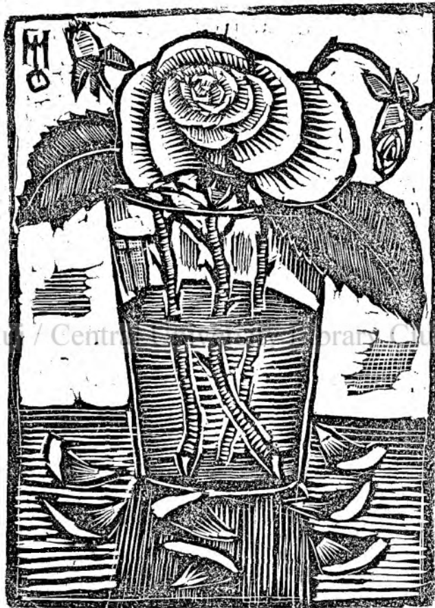
Se scutur trandafirii M. Olinecu