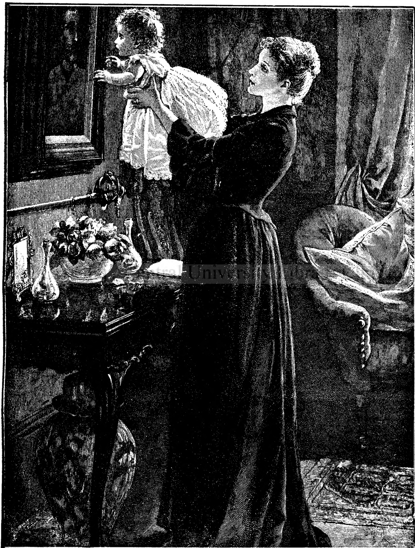
Portretul lui „tata“.