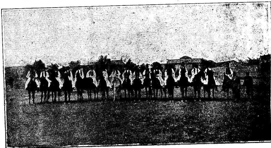
Grupă de călăreți din Nădlac.