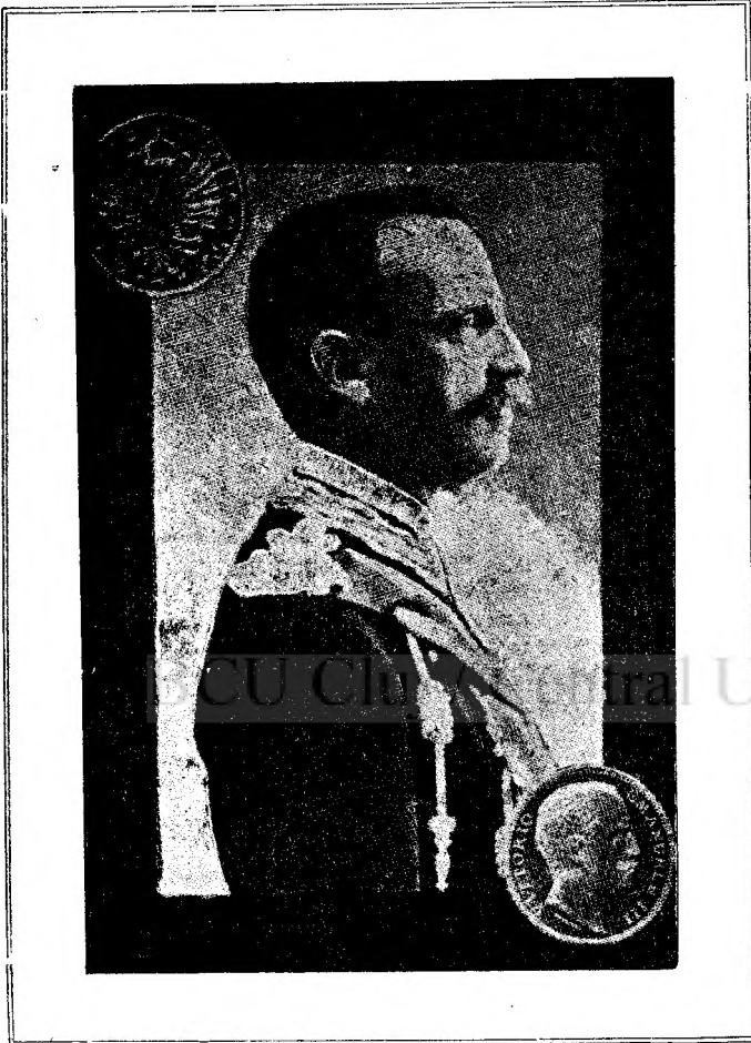
Regele Victor Emanuil III al Italiei.