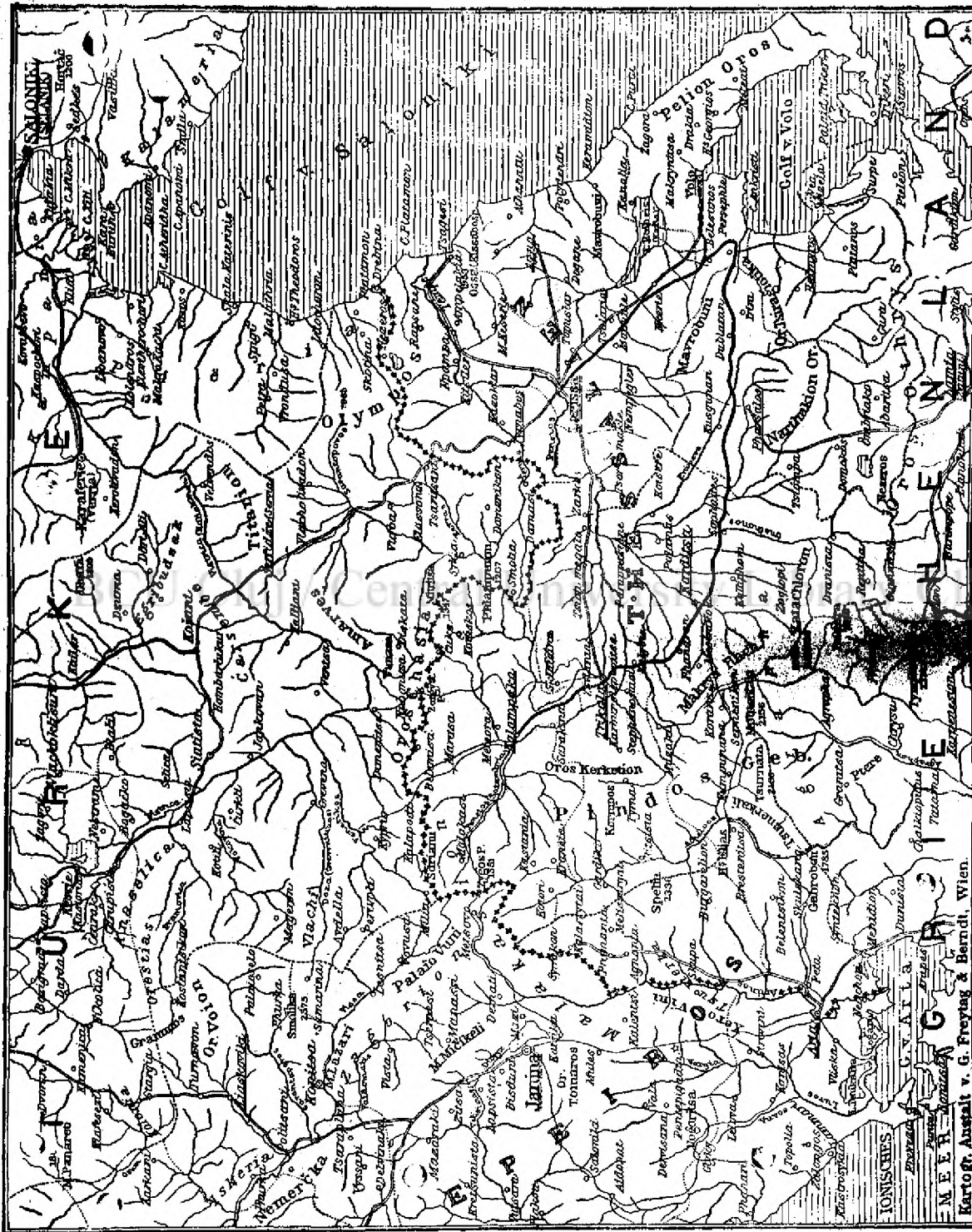
Charta respublice in greco-turc.

Al doilea stâlp, continuu academicianul, a fost Mecena, a cărui viață casnică fiind foarte puțin de învidiat, totuș ca bărbat de stat se poate numi apostolul