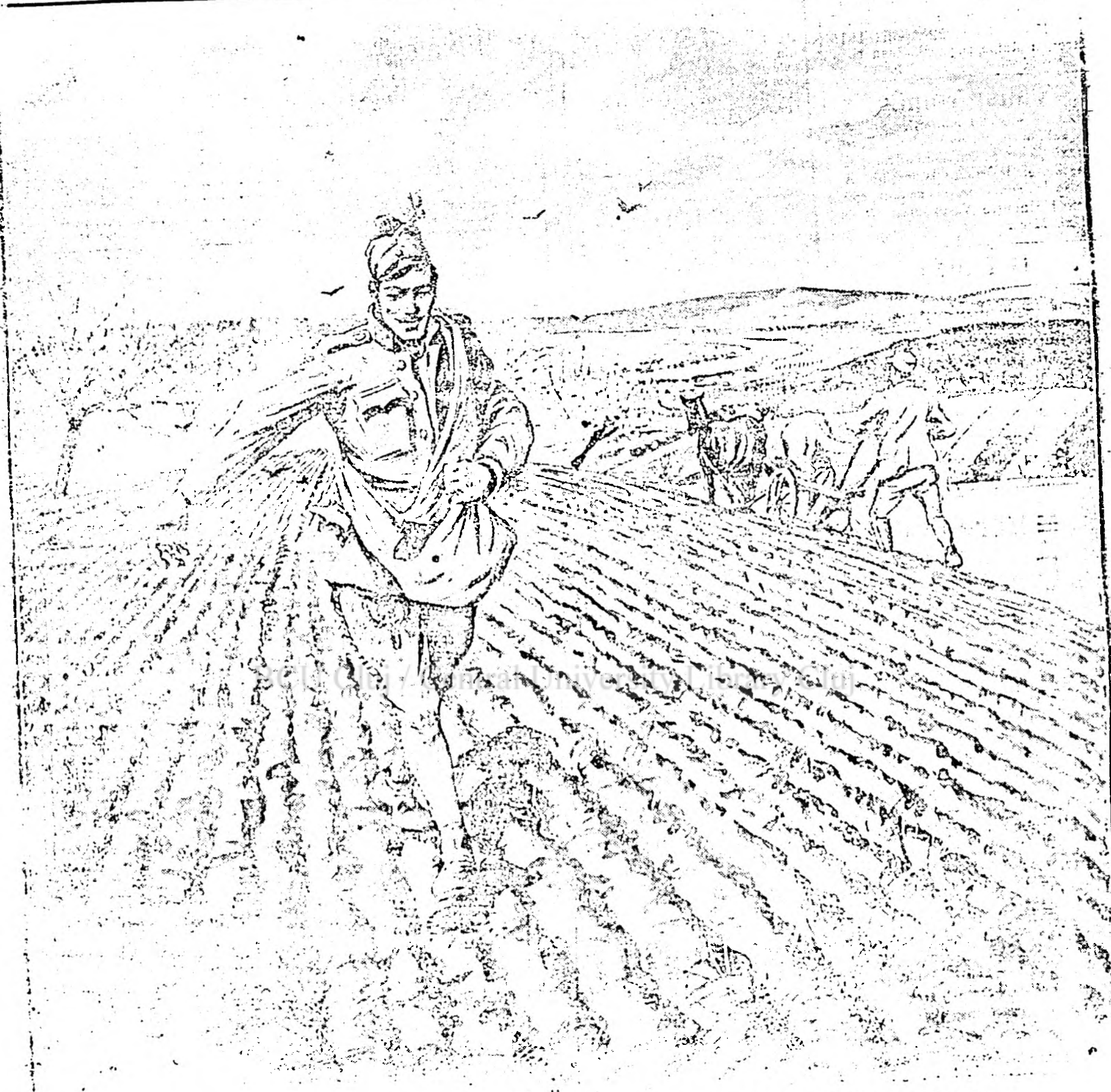
Un soldat concedat își semănă ogorul, pe când altul având pământul se gândește la belșugul de roadă aurie al grâului.