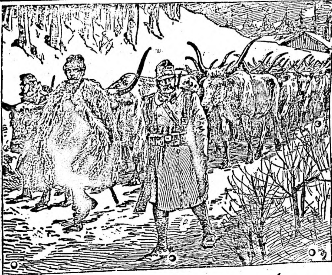
Cu ce se hrănește armata. Boi, ce vor sluji drept hrană pentru armată, sunt duși în dosul frontului.

Tunul de 42 cent metri. Inginerul Dr. Seume, inventatorul și constructorul tunului de 42 centimetri, a ținut zilele acestea o prelegere, în fața mai multor ingineri, despre invenția sa. Eată câteva interesante amănunte din prelegerea Seume: Tunul întreg cântărește 88.750 kilograme. Lungimea țevii e de cinci metri. Greutatea glonțului este de 400 kilograme, lungimea lui de 1 metru 25 cm. Părțile singurate, dela care se compune tunul, sunt în număr de 172, pentru a căror transportare se cer 12 vagoane. Fundamentul, unde se zidește tunul, are adâncime de opt metri. Celata Laga a fost bombardată dela distanță de 28 kilometri. Siguranța de nimerire variază între 1 și 3 metri. La prima tragere asupra numitei cetăți au căzut 1700 soldați, la a doua tragere 2800 soldați. S'au tras cu totul 5 gloanțe. Namurul și Maubouge au primit câte 2. Montarea tunului durează 25—26 de ceasuri; îndreptarea sa, după ce prin alte tunuri s'a stabilit distanța, ține 6 ore. Soldații de serviciu, când se descarcă tunul, poartă chipiuri apărătoare de urechi, ochi, gură și nas, și trebuie să stea întinși pe burtă. Pe un cerc de patru kilometri, de câte ori se sloboade tunul, se sparg toate geamurile edificiilor. O împușcătură costă 11 mii de mărci. Tunul acesta, la care servesc 260 de oameni, este întreg subminat: în caz de pericol inginerul conducător e îndatorat să arunce în aer toată construcțiunea.