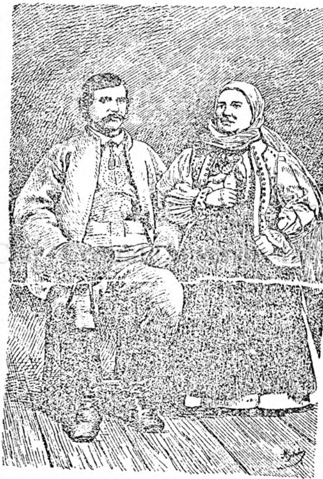
Port din Zarand.

A 12-a și cea din urmă ședință literară din 1903, s'a ținut Joi la 31 Decembrie n. în localitățile »Reuniunii sodalilor români din Sibiu« fost loc de întâlnire și în 1903 pentru sute de oameni iubitori de progres. Aici măiestrii cu cunoștințe, câștigate în cursul vieții destul de sbuciumate, își espun experiențele, din cari tinerimea își croiește ogăsele de urmat în viitorul apropiat; sodalii (calfele), damele din cor și alții, folositoare ne procură tuturora prin cetirea de bucăți alese, prin predarea cutării poezii frumoase și prin cântări, ce ne înveslesc inimile. Dealtfel, o spun pentru obște, un asemenea așezământ cu chemarea de-a ținea mulțimea la un loc și astfel a o pune o în pozițiune de a se manifesta ca un întreg, ce se respectă și respect așteaptă și dela alții, numai prin continuă acțiune se poate susține, căci în muncă este vieață. Cunosc pe mulți din cercurile Reuniunii, cari conduși sunt de devisa