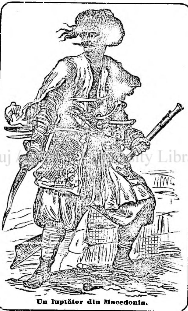
Un luptător din Macedonia.

Armășarii adesea se apucă la luptă violentă între ei, cei tineri își câștigă