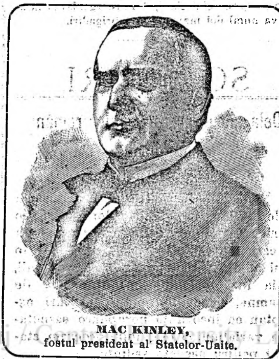
MAC KINLEY, fostul president al Statelor-Unitate.

Din frumoasele ilustrații, ce împodobesc „Călimdarul Poporului“, pe anul 1902, dăm azi portretul lui Mac Kinley.