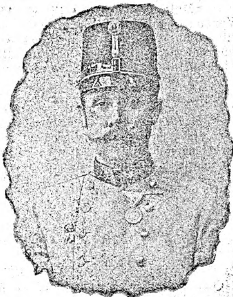
Francise Ferdinand, moștenitorul de tron al Austro-Ungariei.

Am promis bisericii 100 fl. ca fundațiune, dar' aceasta e truda ostenelelor mele și nu dela biserică, precum spune autorul. Eu nu am primit dela biserică decât 7 fl., care cred că i-am meritat, pentru-că de 7 ani nu am voit să primesc nici o remunerațiune, fără am muncit cu drag. Ce mi-a solvit comisarul pentru întreținere nu privește nici pe autor, nici biserică. Acestea au fost lucruri private și nici-decum în defavurul bisericii, ceea-ce documentez cu dl. comisar Romul Pop. Vă laudați, că ați făcut 2000 fl. fără venite și necertați. Eu vă întreb, de unde și când ați făcut acei 2000 fl.? Câți bani gata ați avut în jurnal și în lada bisericii, când am luat cassa în primire la anul 1894? Răs-