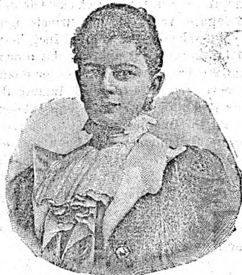
Princesa Sofia, soția moștenitorului de tron Fr. Ferdinand.

pund firm, că cu nici o păra rea, ba încă cu deficit. Erau în adevăr 200—300 fl. în niște maculaturi de obligațiuni fără nici o formă, pe care debitorii nici nu le mai recunoșteau, de oare ce era datorie învechită de 10—15 ani. Cu mari greutate le-am regulat în interval de 7 ani și pe cale pacinică și procesuală cu debitorii, între cari a fost și este și parochul.