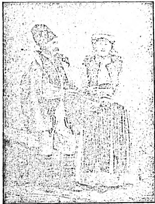
Români din Bănat.