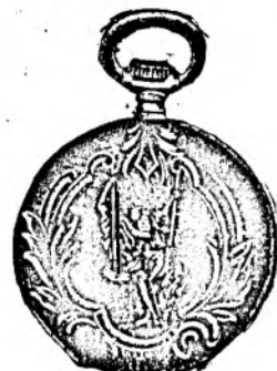
Nr. 5. Orologiu anker-remon. de argint, 50 mm. diametru, capac duplu, 3 capace de argint, 15 rubine, cu cerc de aur, fabricat în, din sorte mai tari fl. 11.50, cu construcție cil.-rem. fl. 9.50.