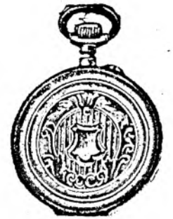
Nr. 7. Orologiu cilindru-remt. de argint nou, 48 mm. diametru, luciu ori gravat, în formă ovală, arătător de secunde, cu placă de cifre albă, emailată, I. calitate, fl. 4.50, cu capac duplu fl. 5.80. Lanțuri de nikel cu compas ori chei 30, 40, 50, 60 cr.

Prospecte bogat ilustrate gratis și franco. Spedări cu rambursă ori pe lângă trimiterea înainte a prețului.