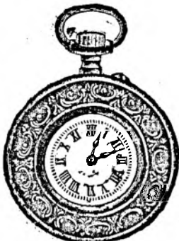
Nr. 3. Orologiu cilindru-rem. de argint, 48 mm. diametru, cu placă de cifre în email albă ori colorată cu toartă ovală, arătător de secunde, construcție bună solidă, fl. 6.75.