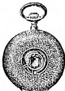
Nr. 4. Orologiu cil.-rem. de argint, 48 mm. diametru, cu capac duplu, în toc gravat frumos, sorte tari, I. fabricat în fl. 8.75.