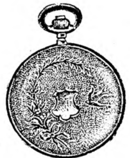
Nr. 2. Orologiu anker-remon. de argint, 50 mm. diametru, cu capac duplu, toc guiloșat ori gravat, 3 capace de argint, 5 rubine, sorte tari, I. fină »Uraniawerk» 15 rubine, fl. 12.50.