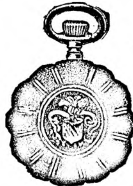
Nr. 6. Orologiu de dame, rem., de aur de 14 carate, 30 mm. diametru, capac duplu, I. calitate, guiloșat ori gravat fl. 25.—, în toc de argint fl. 11.50.