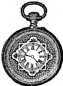
Nr. 1. Orologiu de argint remon-toir, pentru dame; 30 mm. diametru, cu capac de argint, calitate bună fl. 6.75, cu cerc de aur fl. 7.50, de oșel negru oxidat fl. 6.50.

Reparaturi de tot soiul se eșeută bine și conștientios.