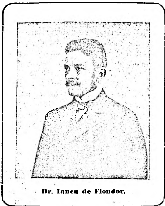
Dr. Iancu de Flondor.