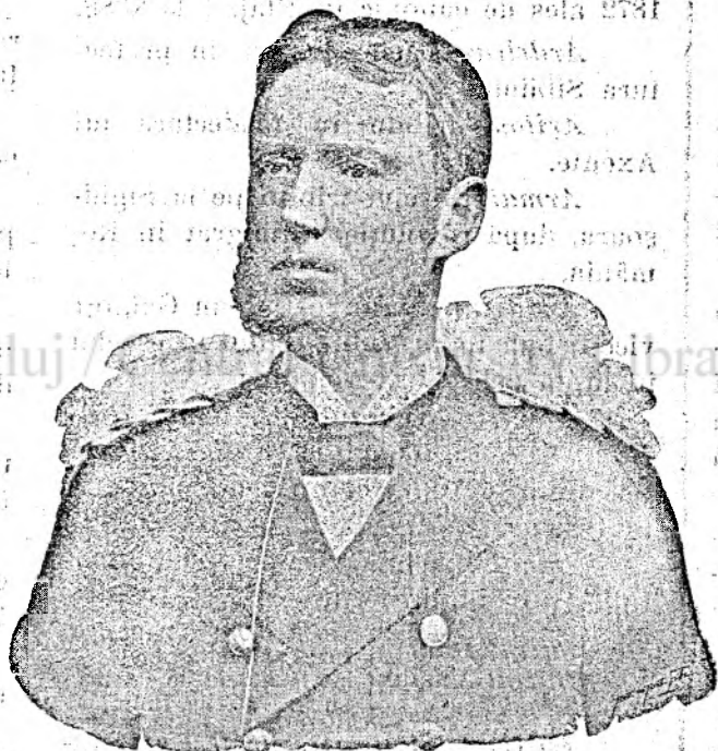
Contele Thun de Hohenstein.

În ori-ce cas atât în Austria , cât și la noi în Ungaria, pace deplină numai atunci va fi între popoare, când nu vor fi apăsători și apesați, ci toate popoarele se vor bucura de drepturi deopotrivă, ceea-ce în interesul împărăției trebuie s'ă se facă.