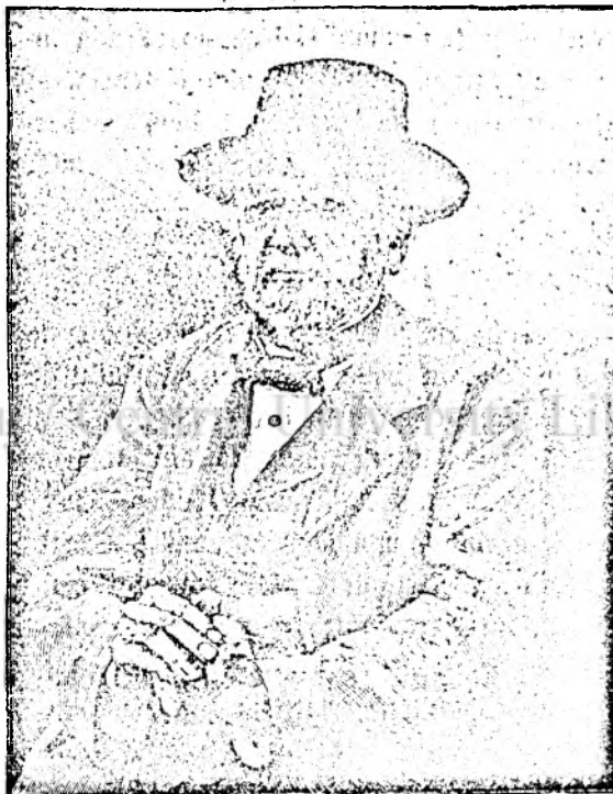
William E. Gladstone.

Întrebînd pe unul din locuitori despre cauza acestei stări, 'mi-a rîspuns că nu poartă nime grije de biserică, că preotul abia caută de ale sale și că „numai de cînd am ales purtători de socoti pe domni învățatori, știm că biserică are venituri”. Voind a mă convinge și despre simțul național al celui preot, 'mi-s'a spus foarte multe, — amintesc însă numai una, ca cetitorii să-și poată face oarecare idee, anume: în primăvara anului trecut a primit și d-lui din „Arginții lui Iuda” descriși într'un număr al Foaiei Poporului, bani, din cari până azi părintescul nostru guvern numai preoților distinși prin sentimentele lor patriotice a avut bunăvoința a le împărți, — cu cari însă mai ales astăzi se tînde la rîplirea libertății și la dejosirea preoțimii noastre. Sau că dl preot din Voislova pune interesul material mai presus de libertatea stărei sale de preot?