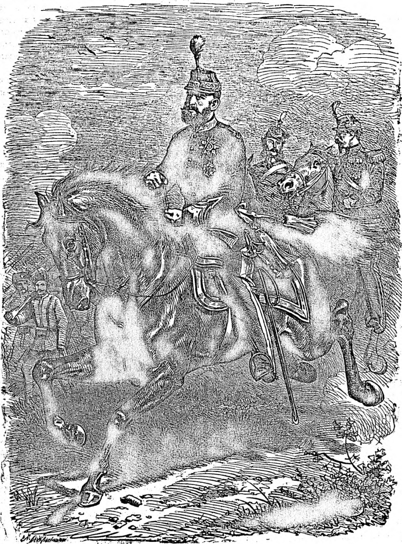
Regele Carol al României.

Mare a fost El în timp de războiu, dar' tot atât de mare a fost și este în timp de pace.