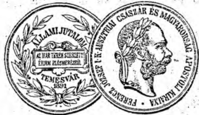
Medailă de bronz de recunoștință.