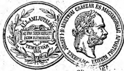
Medailă de bronz de recunoștință.