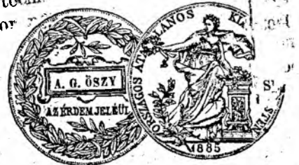
Medailă de argint de stat.