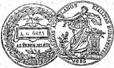
Medailă de argint de stat.