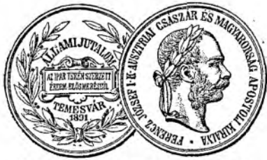
Medailă de bronz de recunoștință.