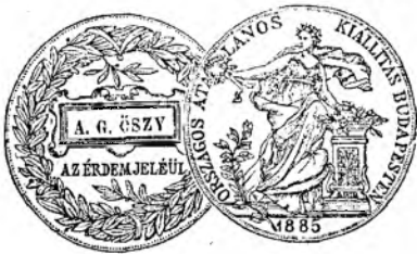
Medailă de argint de stat.