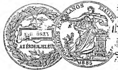
Medailă de argint de stat.