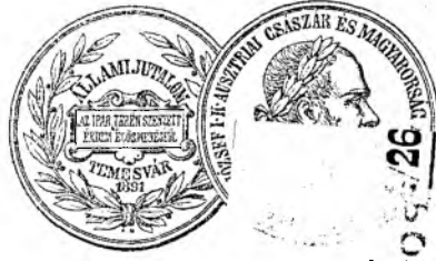
Medailă de bronz de recunoștință.