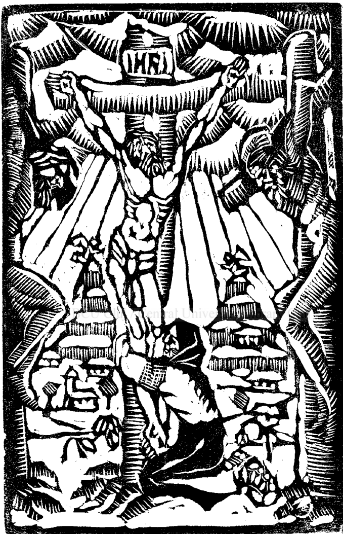
Crucificare săpată în lemn de M. Olinescu