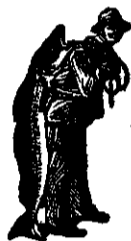
La cumpărarea Emulziei, luați amănăciune să aibă marea de scutire alui Scott: Pescarul

Dă-i oleiul de pește Emulzia SCOTT și cu bucurie vei vedea, că starea lui îndată să întoarcă spre bine, dă spre desvoltare și devine vesel.