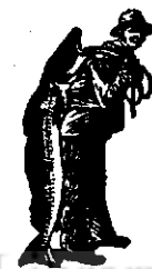
La cumpărarea Emulziei, luați sama să aibă marca de scutire alui Scott: Pescarul

afia un nutremânt sănătos și întăritor în