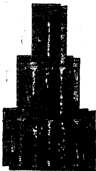
Țigla Bohn de Nagyikinda.